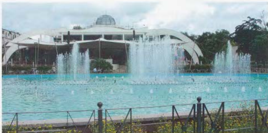
Wasserspiele im Jugendpark in Tirana