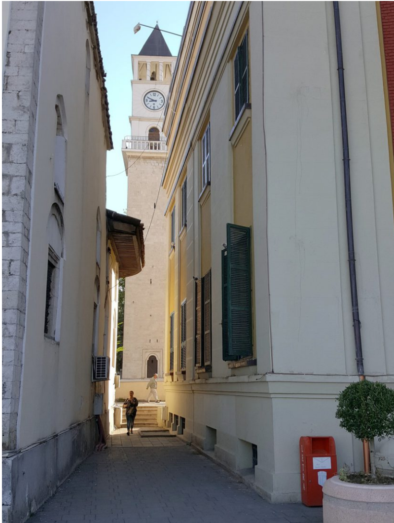
Gasse im Zentrum Tiranas mit Blick auf den Uhrenturm der Ethem-Bey-Moschee