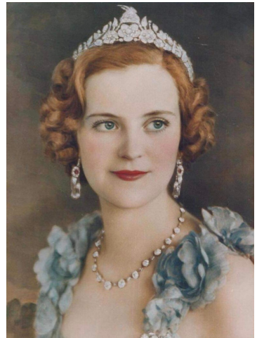
Königin Geraldine