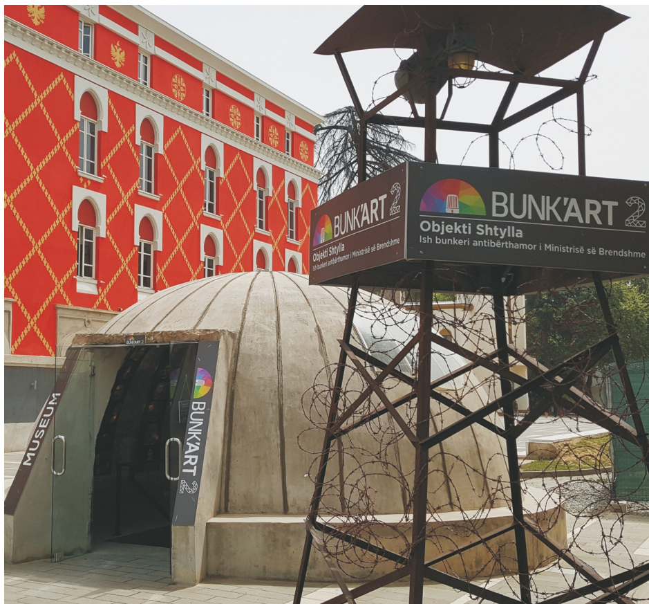
Eingang zur Bunk'Art2 Ausstellung im Zentrum Tiranas (QSL-Motiv)

Mitgliederrundbrief Nr. 75 - Dezember 2020